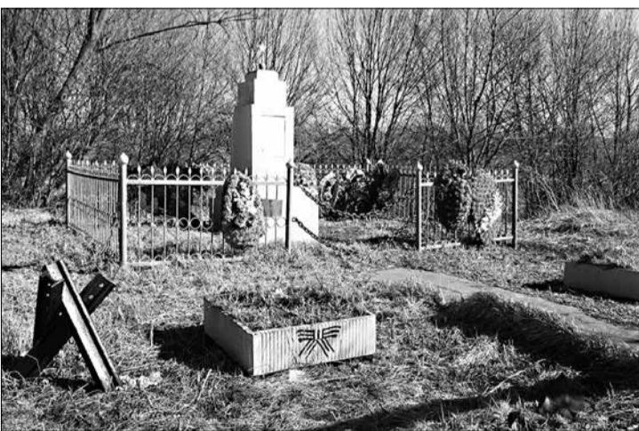
В районе Уткиной заводи расположено Братское захоронение советских воинов, рабочих совхоза и ленинградцев, погибших во время ВОВ (в районе совхоза «Красный октябрь»)

Поселок имени Свердлова нравится своим расположением: рядом с крупным мегаполисом удобный транспортный узел – Кольцевая автодорога, неразводной Вантовый мост через Неву. Согласно планам развития города и области к территории Уткиной заводи будет продлен Дальневосточный проспект, а Покровская дорога будет соединять