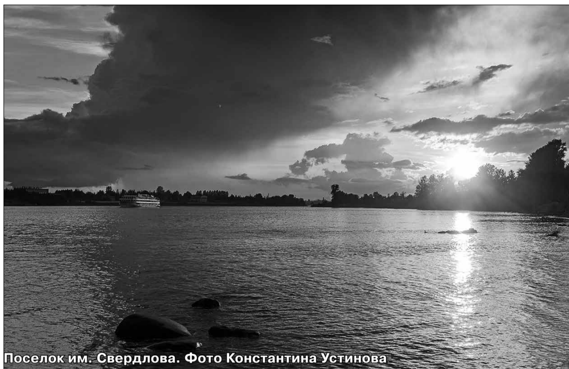
Поселок им. Свердлова.

Совет депутатов и администрация МО «Свердловское городское поселение»