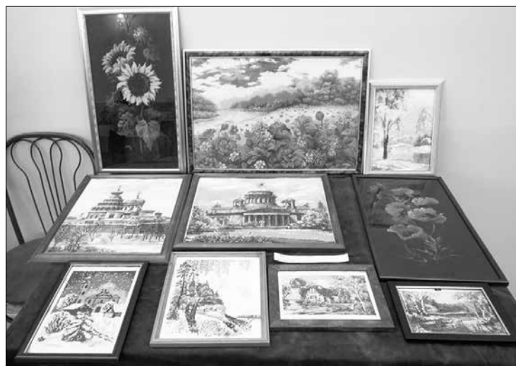
Работы Натальи Полетаевой